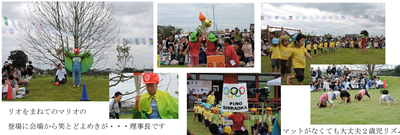
リオをまねてのマリオの

感動・勇気・元気を沢山を貰ったリオオリンピック・パラリンピック・・・ピノ保育園白岡の子ども達にも同じ思いを・・・とピノリンピックを子ども達と創ってきました。結果は基礎体力づくりではまだ保育歴が短いため、不十分な表現もありましたが、一人ひとりの子どもの満足した表情を見ることができて、大いに盛り上がりました。雨天の為延期になり、ご迷惑もおかけしました。でもみなさんがとても協力的で感謝申し上げます。